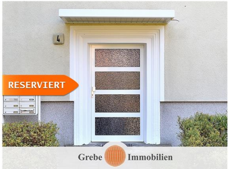
in Zossen / Nächst Neuendorf