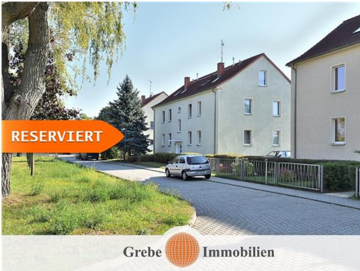
Straße des Friedens 4