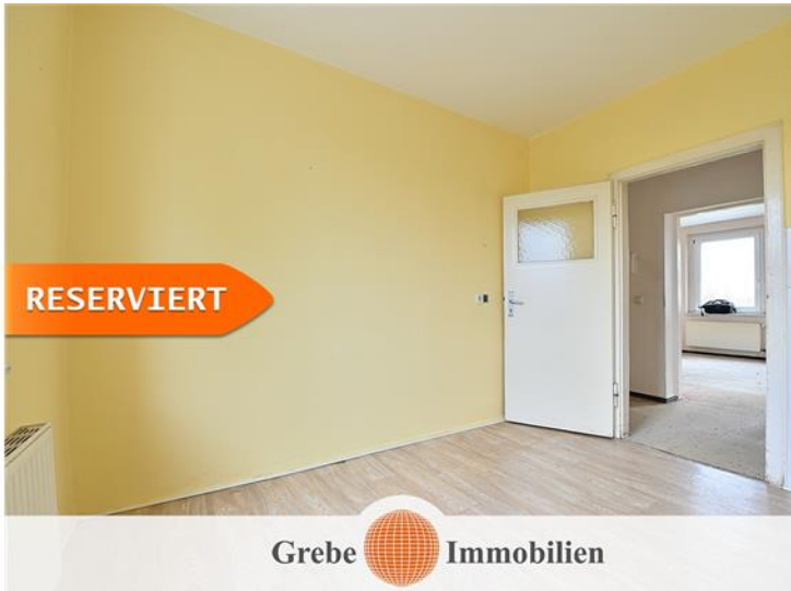
Küche Bild 2