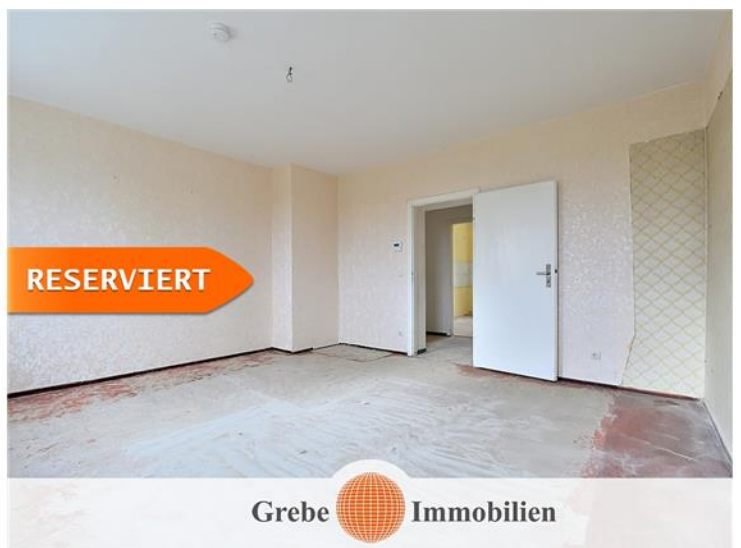
Wohnzimmer Bild 2