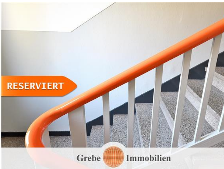
Wohnung im EG rechts