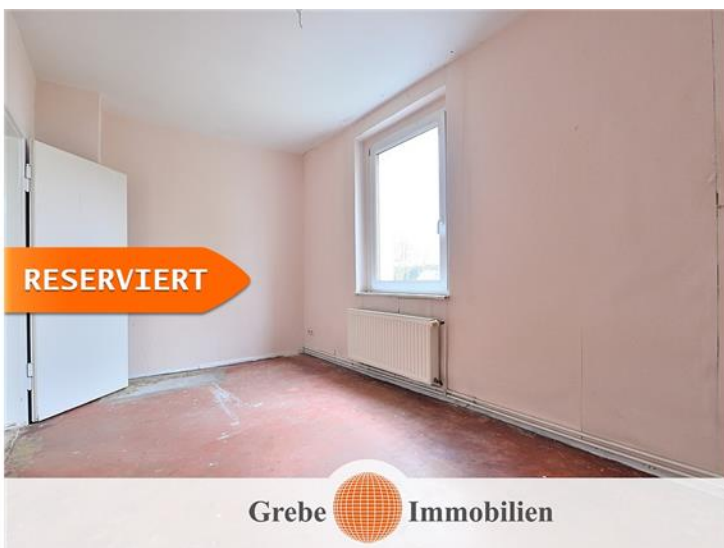
Kinder- / Arbeitszimmer